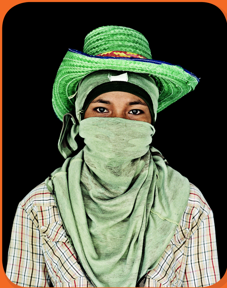
“Asian Worker Covered” Ralf Tooten

แล้วต้นทุนของความหลากหลาย? นักวิชาการมองว่าแรงงานที่มาจากต่างเชื้อชาติต่างวัฒนธรรมอาจจะทำให้สังคมมีความแตกแยก (Fractionalisation) มากขึ้น จากการที่สังคมแบ่งพรรคพวกตามเชื้อชาติ ไม่ยอมรับวัฒนธรรมหรือสื่อสารกับคนที่มาจากกลุ่มเชื้อชาติอื่น แต่ก็ยังไม่มีผลการศึกษาใดที่สามารถยืนยันผลได้ชัดเจนนัก Ashraf and Galor (2013) พบว่าความหลากหลายทางด้านเชื้อชาติที่มากเกินไปจะส่งผลเสียต่อเศรษฐกิจมากกว่าผลได้ ซึ่งเงื่อนไขของการที่ผลดีจะสามารถเอาชนะผลเสียได้อาจขึ้นอยู่กับเงื่อนไขบางประการ อาทิ Lazear (1999) แรงงานต่างชาติมีแนวโน้มเพียงที่จะกลืนตัวเองไปกับวัฒนธรรมหลักของประเทศนั้น ๆ หากขนาดของกลุ่มตนเองนั้นเล็กกว่าของแรงงานท้องถิ่น (Natives) ในระดับหนึ่ง Alesina and La Ferrara (2002; 2005) ศึกษาเรื่องความเชื่อใจระหว่างคนด้วยกัน พบว่าคนที่เชื่อใจกันได้นั้นจะมีพื้นที่หลังทางสังคมที่คล้าย ๆ กัน หรือเคยเจอเรื่องร้าย ๆ มาเหมือน ๆ กัน อีกทั้งยังได้เสนอไว้ดีกว่า สังคมที่จะได้รับประโยชน์จากความหลากหลายของแรงงานต้องเป็นสังคมที่มีความซับซ้อนทางเศรษฐกิจสูง และบทบาทของรัฐบาลมีแนวโน้มที่จะเล็กลงเรื่อย ๆ เป็นต้น การที่เงื่อนไขเหล่านี้จะเกิดขึ้นมันก็อาจจะยากมากในปัจจุบัน โดยเฉพาะในประเทศที่กำลังพัฒนา ข้อค้นพบในมุมมองนี้ยังคงหลากหลายและยังไม่มีท่าทีว่าจะนิ่งหรือได้ข้อสรุปในเร็ววัน