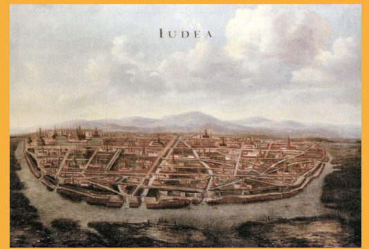
แผนที่กรุงศรีอยุธยา ปี พ.ศ.2206

Network) ในสามประเทศ คือ ญี่ปุ่น อินเดีย และสยาม ซึ่งบริษัท VOC ทำประโยชน์จากการค้าของประเทศอื่นได้โดยไม่ต้องนำทรัพยากรประเทศตัวเองมาเกี่ยวข้อง สามเหลี่ยมการค้านี้เป็นไปเพื่อสนับสนุนฐานอำนาจทางเศรษฐกิจสำคัญของชาวดัตช์ที่ปัตตาเวีย (อินโดนีเซียในปัจจุบัน) ซึ่งถูกบริษัท VOC ครอบครองอย่างเบ็ดเสร็จ แตกต่างไปจากท่าที่ที่ VOC มีต่อสยาม